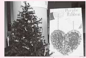
1Fサロンに設置されているパープルリボンツリーと作品

県男女共同参画センター相談室 相談専用電話 099-221-6630/6631 (配偶者暴力相談支援センターに指定されています。)