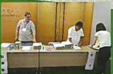
週間事業の受付サポート

4月19日(土)に今年度のサポーター委嘱式がありました。今回委嘱を更新されたのは、センターサポーター2人と託児サポーター10人の合計12人です。センターサポーターは事業運営をサポートしたり、センターの情報発信したりします。託児サポーターは、託児サービスを行う事業でお願いしたりお子さんを安全に見守ります。よろしくお祈りします!!