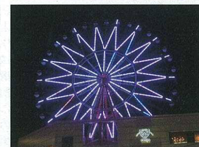
アミュプラザ鹿児島のご協力により、アミュランがパープルに点灯。また、高見橋、西田橋もパープルにライトアップ