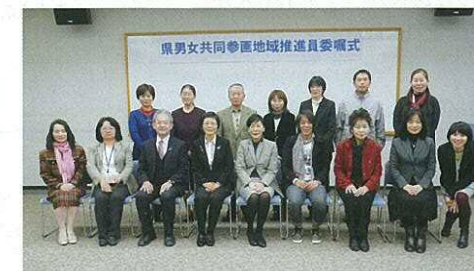
今回委嘱を受けた推進員の方々