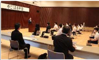
明日の鹿児島を担う若きリーダーたち(開講式)

今年度の開講式は、7月19日(日)に県民交流センターで、塾長である県知事も臨席し、開催しました。参加した40名の塾生たちは、鹿児島にゆかりのある企業のリーダーと直接対話したり、先進的な取組を行う県内企業の魅力や今後の可能性に触れたりしながら、塾生同士の交流を図り、相互の絆を深める内容に大変期待しているようでした。