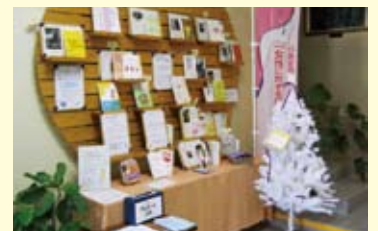
【パープルリボンキャンペーンの展示】