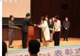
令和元年度県自作視聴覚教材コンクール表彰式の様子

○ メディア研修講座 教育メディアを活用できる人材育成のため、各種講座を実施します。受講者自身のパソコンの持ち込みも可能です。 ○ 市町村等メディア研修支援 市町村等が実施する情報モラルセキュリティ、親子プログラミング教室、情報機器活用等の研修・職員派遣し、教育メディア活用の促進と教育的課題の解決を支援します。 ○ 生涯学習及び視聴覚教育の調査研究 生涯学習に関する情報の提供及び相談 ○ 視聴覚教材の整備・貸出 教育の関係機関・団体等を対象に、県視聴覚ライブラリーとしてDVD・16ミリフィルム等の各種映像教材の貸出を行っています。 ○ 県自作視聴覚教材コンクール 県視聴覚連盟と協力して、デジタルコンテンツや動画・静止画等に関する自作視聴覚教材コンクールを行い、教材製作を奨励しています。たくさん作品の応募をお願いします。 ○ 『アジア国際子ども映画祭』 今年度は中止となりましたが、九州ブロック内の小学生・中学生・高校生及びそれらの年齢に相当する個人またはグループを対象に動画作品を募集し、南あわじ市で開催される「アジア国際子ども映画祭」に参加する作品を選定します。