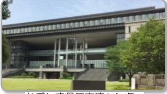
かがしま県民交流センター

そこで、県民交流センター内に県・市町村・大学等を総合的に調整する本県の生涯学習推進の中核として「かがしま県民大学中央センター」が設置されています。また、本センターは、県教育庁社会教育課教育課の出先機関であるとともに、知事部局の「生涯学習課」としても位置付けられています。