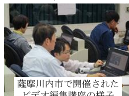
薩摩川内市で開催されたビデオ編集講座の様子

※なお、昨年度まで実施していた「ふるさとおこしリーダー育成講座」と「メディア研修講座(県民対象分)」は、事業終了となっています。