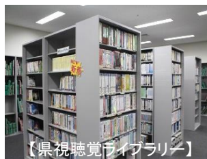
【県視聴覚ライブラリー】

また、本センターのホームページでは、県視聴覚ライブラリーに関する各種情報を発信していますので、ぜひ御覧ください。