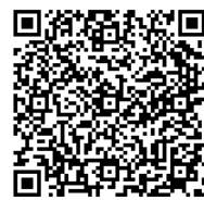
【ホームページQRコード】