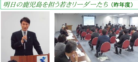
明日の鹿児島を担う若きリーダーたち(昨年度)

◆ かがしま青年塾 これからの鹿児島を担う青壮年層を対象に、各界で活躍する経営者やリーダーとの交流・現地研修・宿泊研修等を実施します。(7月～12月)