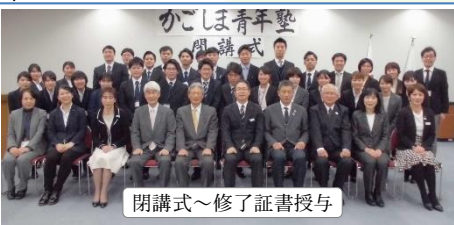
閉講式～修了証書授与